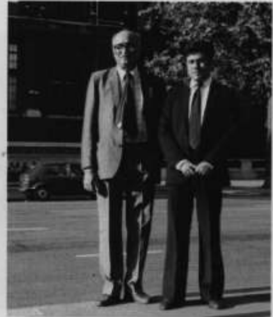
ستمبر 1983ء، لندن: نجم بیگ چٹھائی کے ہمراہ۔