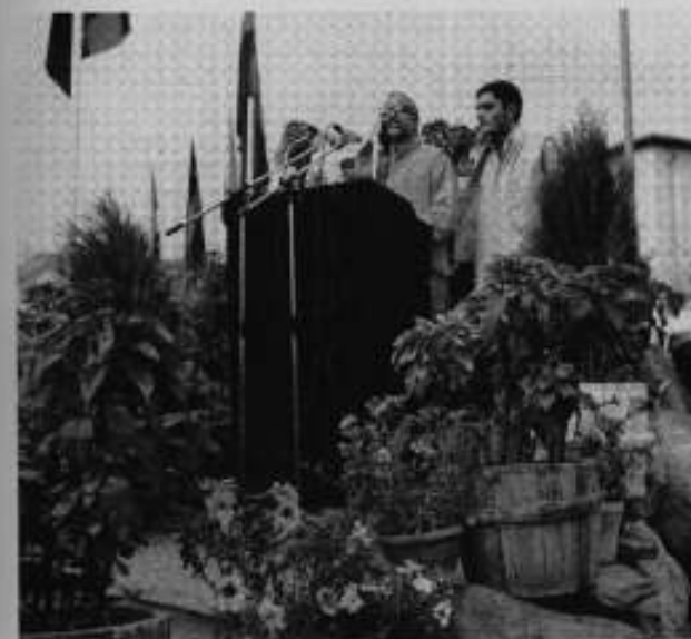
جشن پختونستان: تقریر کے دوران اجمل کے ساتھ اعظم ہوتی۔