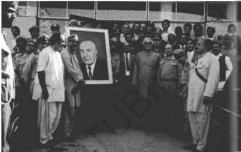
جون 1974ء ولی خان کو تورخم بارڈر پر الوداع: (بائیں سے) تور لالی، اجمل خٹک، کورکمانڈر یونس خان، گورنر عزیز اللہ واصفی۔