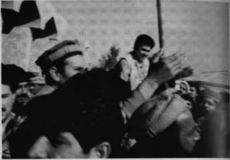
افغانستان سے والہی پرپشاور انٹرپورٹ پر استقبال۔