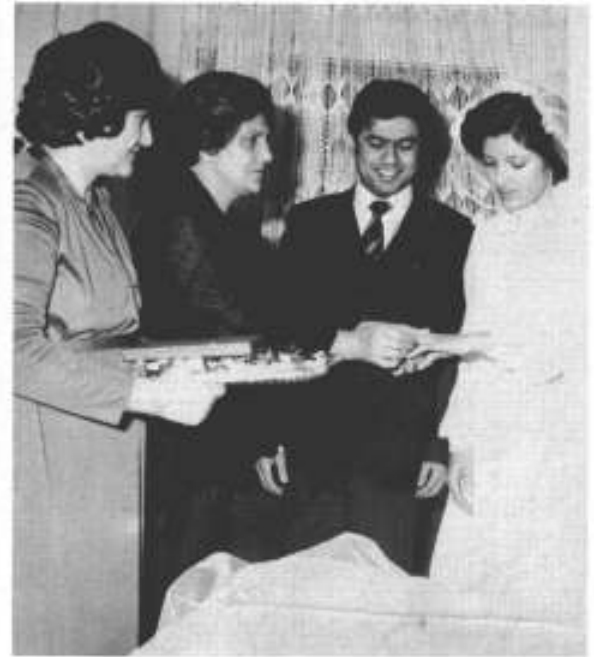
منگنی: ماہرہ (ساس)، محبوبہ کارمل، صوفی اور ہوسٹی۔