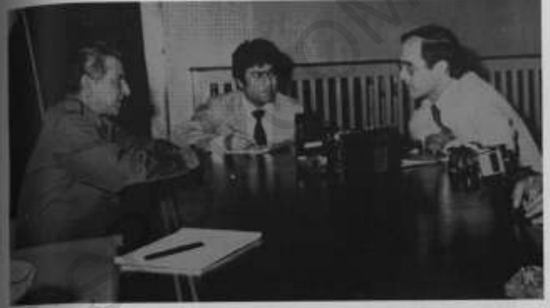
صدر بہرک کارمل کے ساتھ امریکی جریدے 'ٹائمز' کے سفارتی نامہ نگار مشروب ٹالیوٹ کے انٹرویو کی ترجمانی کرتے ہوئے۔ یہ بعد میں صدر کلنٹن کی انتظامیہ میں خارجہ امور کے اسسٹنٹ سیکرٹری اور اب 'بروکننگز انسٹی ٹیوٹ' کے سربراہ ہیں۔ اکتوبر 1981ء