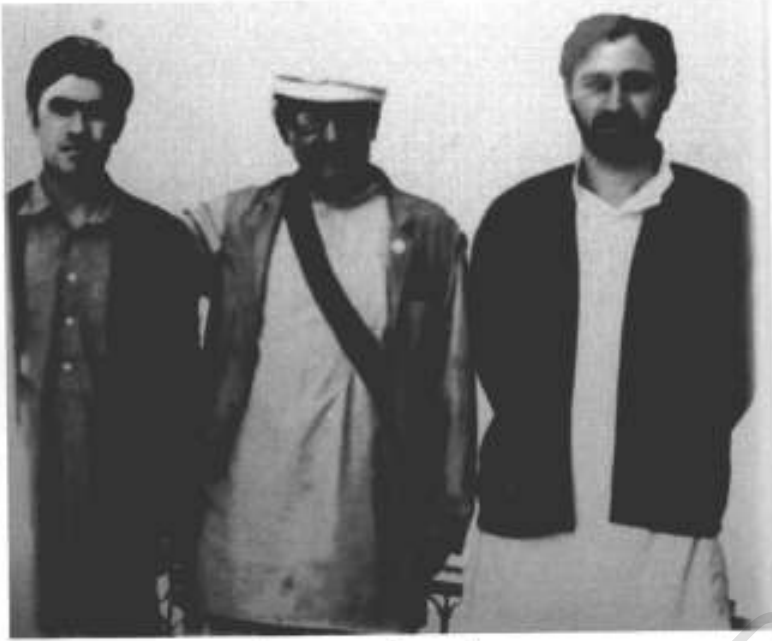
1975ء، کابل: صوفی، تور لالی، عالمزیب۔