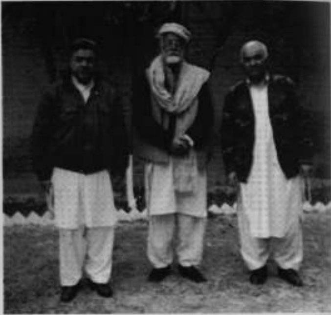
فروری 2003ء، پشاور: صوفی، اجمل خشک اور پکیتیا وال۔