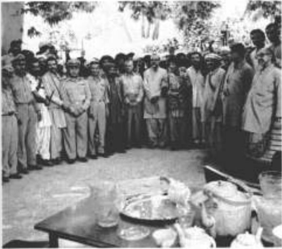
ریشور، کورہیڈ کوارٹر: (جشن افغانستان کے موقع پر)

جنرل غلام حیدر رسولی اور دیگر جرنیلوں کے ساتھ اجمل خٹک اور اعظم۔