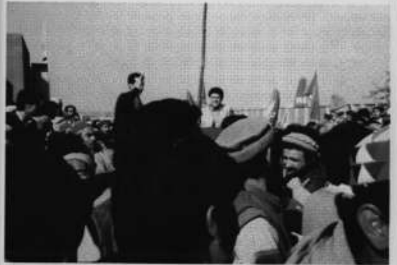
افغانستان سے واپسی کے موقع پر پشاور ائر پورٹ (اب باچا خان انٹرنیشنل ائر پورٹ) پر استقبال۔