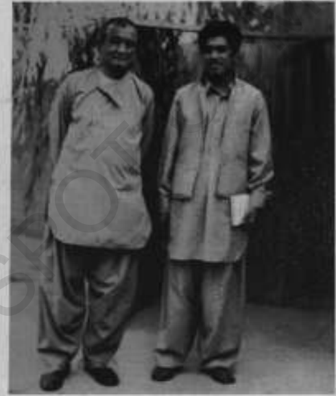
اگست 1976ء، جمال بینہ، کابل: افغان مصنف اور مورخ، عبدالحی حبیبی کے ساتھ۔