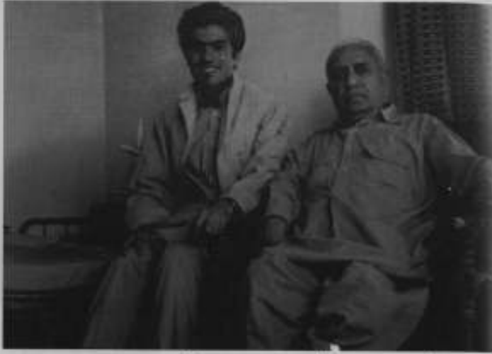
کابل: (داؤد خان کے عہد میں) صوفی اور میاں شاہین شاہ۔