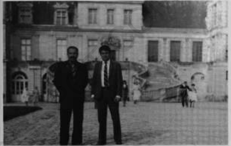
ستمبر 1983ء، صوفی اور افغان نائب صدر گل آقا پیرس میں 'لی ہیومنٹے' کے جشن کے موقع پر۔