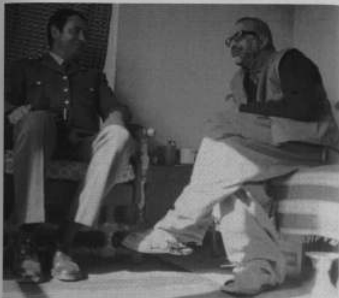
اجمل خٹک اور ریپبلکن گارڈ میں انٹیلی جنس ڈائریکٹر عبدالحق علوی۔