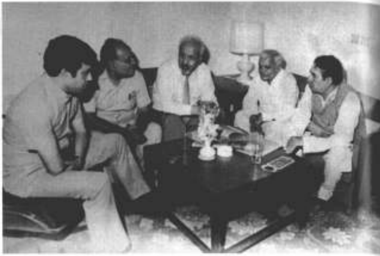
1987ء، دہلی: (بائیں سے) صوفی، بھارتی سیاست دان سلیمان لائق اور دو بھارتی دوست۔