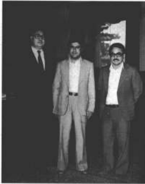
وزیراعظم سلطان علی کشت مند اور ان کے بھائی 'اسد اللہ کشت مند' کے درمیان، وزیراعظم ہاؤس میں، 17 مئی 1981ء