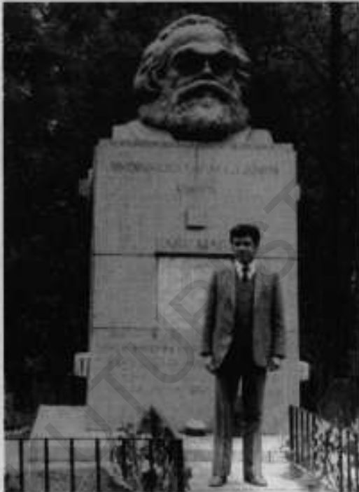
ستمبر 1983ء، ہائی گیٹ، لندن: کارل مارکس کی قبر پر