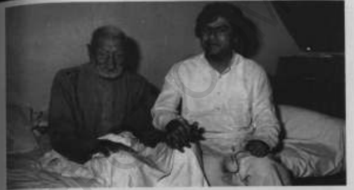
12 اپریل 1982ء: کابل میں باچا خان کے ساتھ باچا خان کے گھر