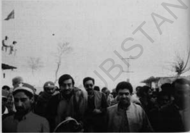
افغانستان سے واپسی پر گاؤں کے راستے میں استقبال۔