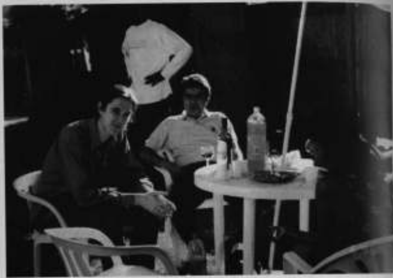
1996ء، لندن: آئر لینڈ کے دوست کے ہمراہ۔