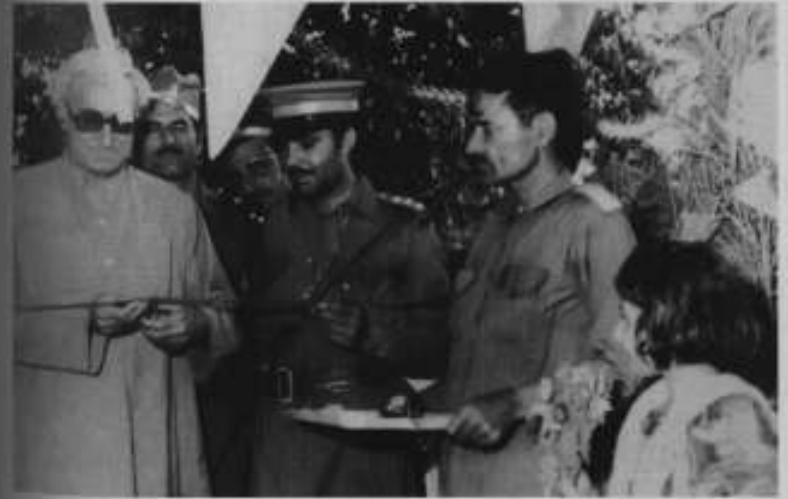
1973ء، یونیورسٹی ٹاؤن، پشاور: ولی خان پختون زلے کے دفتر کا افتتاح کرتے ہوئے۔ ساتھ کمانڈر ہدایت اللہ ہیں۔