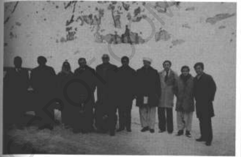
دسمبر 1973ء، سالنگ پاس: (دائیں سے) صوفی، جمال، یکمور، اجمل ٹٹک وزیر سرحدا ت با چا گل وقادار، ولی خان (اس کے سامنے بیٹھے ہوئے اسلم وطن جار) وزیر داخلہ فیض محمد خان محمود (ان کے سامنے بیٹھے ہوئے سید محمد گلاب زوے)، بیکم نسیم ولی، تور لالی اور ڈرائیور۔