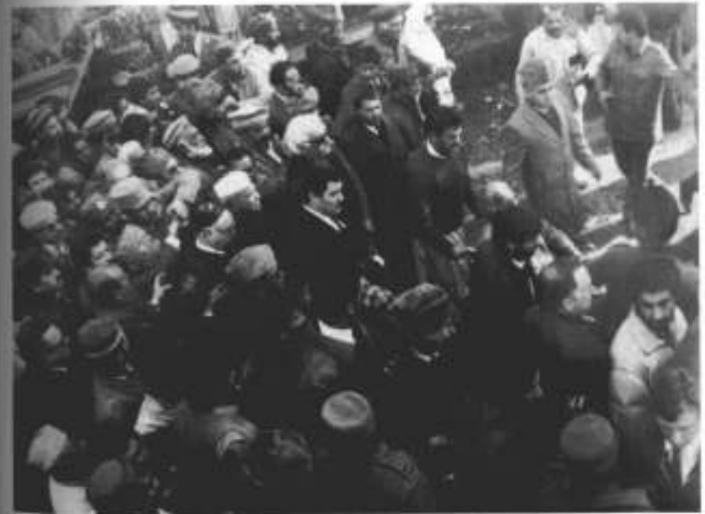
21 جنوری 1988ء، جلال آباد، باچا خان کا جنازہ: ڈاکٹر نجیب اللہ افغان اور بھارتی مہمانوں کے ساتھ۔