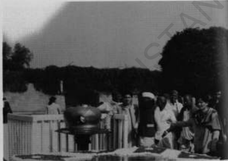
1989ء میں ہماری والہی براستہ بھارت: دہلی میں گاندھی جی کی سادھی پر۔