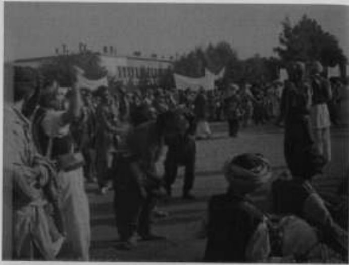
پختونستان کا جشن اور قومی انٹرا (رقص)۔