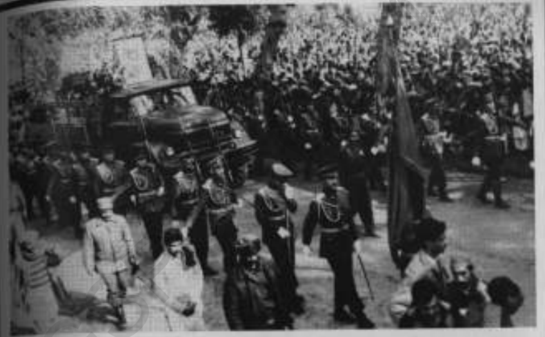
21 جنوری 1988ء جلال آباد: باچا خان کا جنازہ