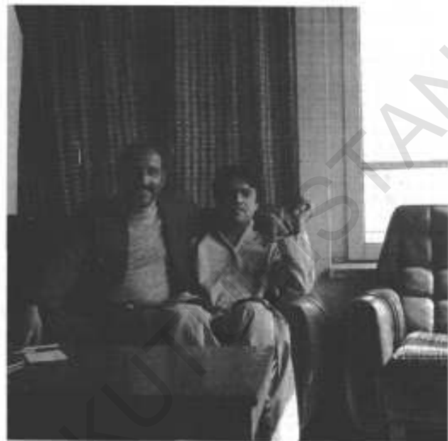
رشید وزیر کے ساتھ۔