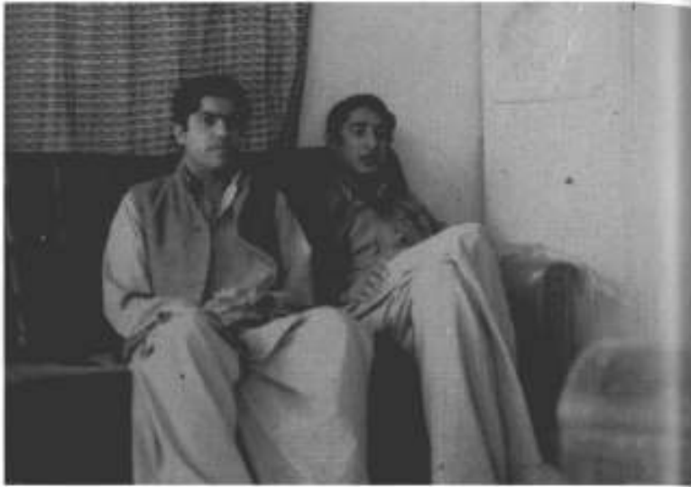
نومبر 1977ء کا بل: صوفی اور سنگین ولی۔